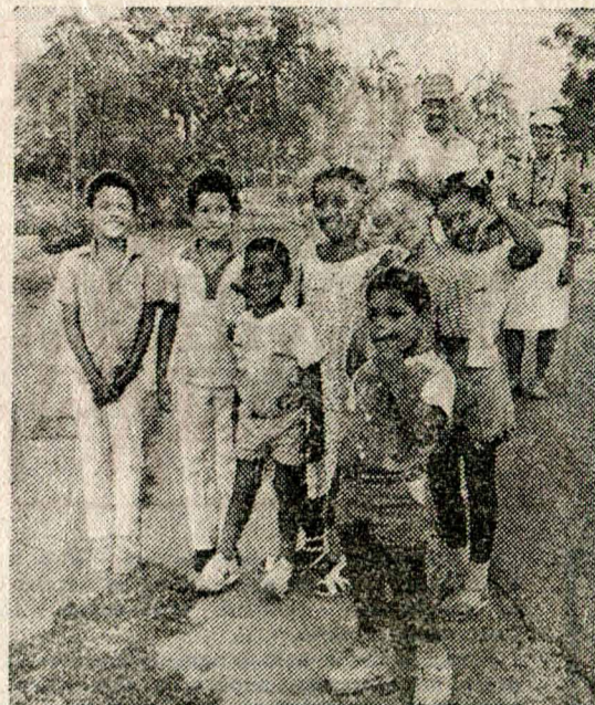
Эти ребята живут в кубинском городе Сантьяго-де-Куба.